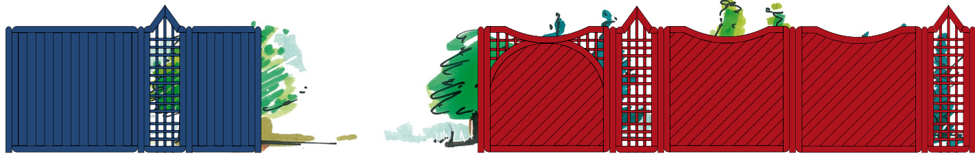
Abb. zeigt eine Kombination aus den Gestaltungselementen A, I und B in der Farbbehandlung 31 sowie Pfosten und Beschläge.