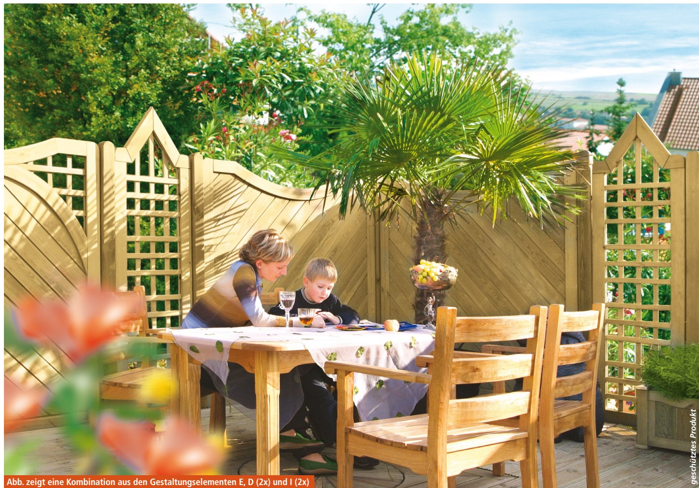
Abb. zeigt eine Kombination aus den Gestaltungselementen E, D (2x) und I (2x)